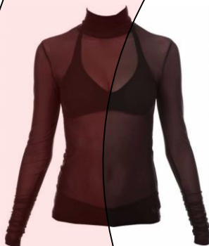
Hauts transparents (filet) sans camisole