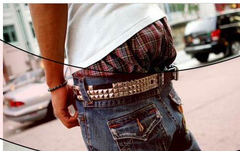
Vêtements qui laissent paraître les sous-vêtements