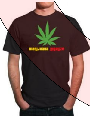
Vêtements avec message de violence, de drogue, d'alcool ou à connotation sexuelle