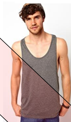
Camisole ample et décolletée