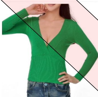
Hauts très décolletés