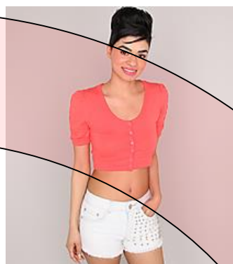
Chandails bedaine et/ou shorts/jupes très courtes