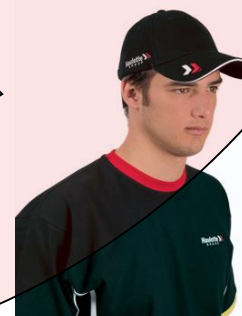
Casquette, tuque, capuchon ou autre en classe, à la cafétéria, à la Salle Claude-Roy, à la réception et au 2 e étage